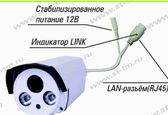
Рис. 1 Схема подключения